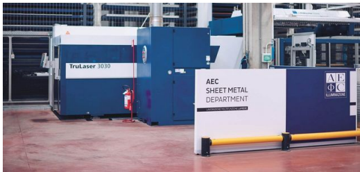
Mit der 2D-Laserschneidmaschine TruLaser 3030 fiber legte AEC Illuminazione den Grundstein für die enge Zusammenarbeit mit TRUMPF. Die Anbindung an ein automatisiertes Lager hat die Fertigung enorm beschleunigt.

in den Gängen auf die Weiterbearbeitung. Damit es nicht dazu kommt, braucht es transparente und durchgängige Informationsflüsse. Aus diesem Grund hat Bianchi bereits jetzt 85 Prozent aller Maschinen vernetzt. Das Produktionssteuerungssystem MES erstellt Produktionspläne und sorgt dafür, dass die Fertigung im Fluss ist. Die Konstrukteure übermitteln ihre CAD-Zeichnungen direkt an die Maschine. Dort werden die Daten eingelesen und dann gefertigt, wenn die Teile benötigt werden. Außerdem sammelt MES Maschinendaten und Kennzahlen zur Qualitätsüberwachung, zur Maschinenauslastung sowie zum Produktionsstatus. „Mit dieser umfassenden Vernetzung ist es uns gelungen, unsere Produktion transparent zu machen. Diese auf den Menschen und die Maschine ausgerichtete Produktionsplanung hilft uns, die Durchlaufzeiten zu erhöhen und unsere Liefertreue nachhaltig zu verbessern“, resümiert Bianchi.