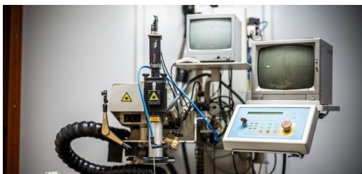
Was überzeugt, bleibt im Einsatz. Gleichzeitig investiert BBW regelmäßig in die aktuellsten Laseranlagen auf dem Markt und erweitert sein Portfolio stetig.