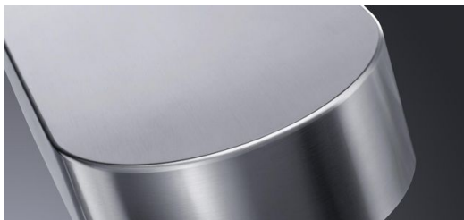
Besonders wenn höchste Ansprüche an die Qualität der Nähte gestellt werden, punktet das Laserschweißen.