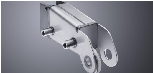
TRUMPF Medizin Systeme setzt in der OP-Tisch-Fertigung auf die Pluspunkte vom Laserschweißen.

Wie man die richtigen Parameter für das eigentliche Laserschweißen findet, vermittelt ein weiteres Trainingsmodul. TRUMPF Experte Nikolaus Wagner: „Verbindliche Parameter wie in den Technologietabellen für das 2-D-Laserschneiden erlaubt die Komplexität im Schweißen nicht. Wir haben jedoch für ganz viele Anwendungen Korridore und Zielwerte dokumentiert, die dem Anwender in der Praxis ganz konkrete Hilfestellungen geben. Und schnell zum Gutteil führen.“