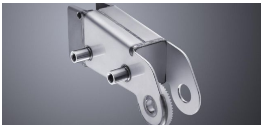
<p> TRUMPF Medizin Systeme setzt in der OP-Tisch-Fertigung auf die Pluspunkte vom Laserschweißen.</p>