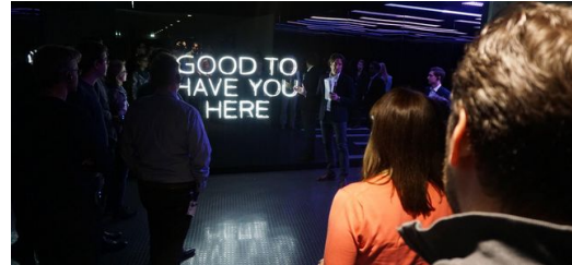
Der Schriftzug im TRUMPF eigenen Tunnelsystem ist in Handarbeit exklusiv für das Unternehmen angefertigt worden. Elektroden regen das Gas im Inneren der Schrift an und bringen sie zum Leuchten.