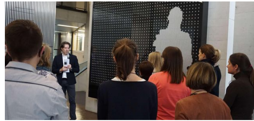
Gut zwei Duzend Kollegen haben sich in der Lobby des Vertriebs- und Servicezentrums versammelt, um sich über die neue Welcome Passage zu informieren.