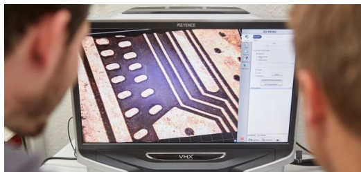
Bei der Sichtprüfung wird der homogene Abtrag dokumentiert. Die Abtragzone ist dunkel und zeigt die Kunststoffoberfläche. In der Bearbeitung kommt es darauf an, die Zwischenräume rückstandsfrei abzutragen, um eine elektrische Isolation zu erreichen.