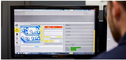
Die Maschinensoftware Photonic Elements zeigt die Abtraggeometrie, die während des Prozesses ausgeführt wird.

kann nicht Spezialist für jede am Gesamtprozess beteiligte Maschine sein.“