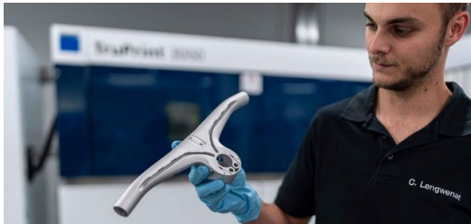
Der Lenker basiert im Wesentlichen auf einer Einheit mit halbinternen Kanälen für die Bremskabel.

Gewicht – das macht den Alu-Druck vor allem für die Fahrradindustrie so interessant.“