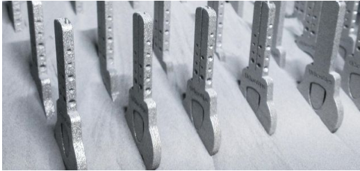
Das 3D-Druck-Verfahren erlaubte es den jungen Ingenieuren von UrbanAlps, die Form von Schlüsseln völlig neu zu denken.

Je besser die Wissenschaft das Laserlicht und seine Wirkungsmechanismen versteht, desto mehr Anwendungsideen und damit Unternehmensideen entstehen daraus. Die neuen Gründer sind – analog zu den berühmten Stanford-Boys im Silicon Valley – oft Postgraduates und Postdocs, die aus ihrer Forschungsarbeit eine Vermarktungsidee ableiten. Und Wagniskapitalgeber sind gerne bereit, hier eine lohnende Investition zu tätigen. Da die Ideen aus der freien Forschung kommen und nicht aus einem engen Anwenderproblem heraus entstehen, sind sie so vielgestaltig wie nie.