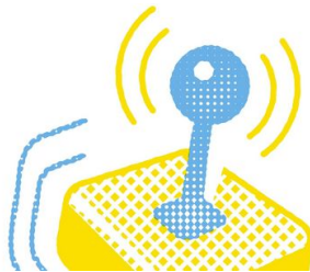
Die Fernsteuerung fühlt sich einfach nur okay an. - Gernot Walter