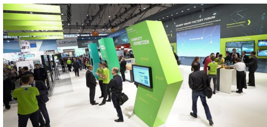
Dank der grünen T-Shirts der TruConnect Berater wurden Besucher, die Fragen zu den TRUMPF Lösungen für die Smart Factory hatten, schnell fündig.