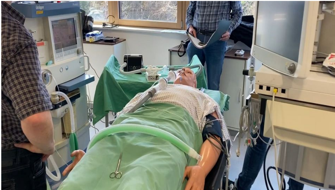
Forscher und Mediziner der Universität Marburg testen das Beatmungsgerät an einer Puppe.