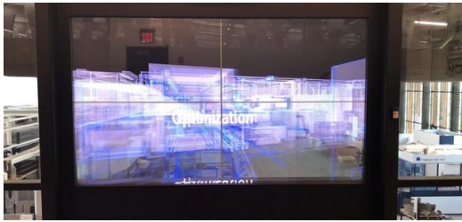
Willkommen in der Smart Factory!