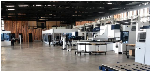
Hier lernte er mehr darüber, welche wichtige Rolle Software beim Fertigungsprozess spielen kann, und welche neuen Arbeitsweisen und smarten Technologien für die Industrie entwickelt werden.