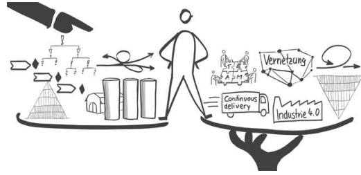
Für eine flexible Organisation ist beides nötig: Stabilität und Agilität. Grafik: Denis Gabriel