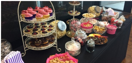
Bei Cupcakes und Brownies lernen sich die Teilnehmer der 1. AgileDays bei TRUMPF besser kennen.

Mein persönliches Programm habe ich mithilfe der Konferenz-App selbst erstellt. Weil ich Agile-Neuling bin, habe ich mich online für den Workshop „Scrum Lego City“ eingetragen. Hier sollen die Teilnehmer die Scrum-Methode kennenlernen, indem sie als Team eine Stadt aus Lego-Steinen planen und bauen. Das Konzept stammt aus der Softwareentwicklung und wird heute in den verschiedensten Branchen eingesetzt. Für unsere Lego-Stadt erhalten wir konkrete Vorgaben, zum Beispiel ein Schwimmbad mit Rutsche oder Infrastruktur für öffentliche Verkehrsmittel. Im „Backlog“ und im „Planning“ beurteilen wir die Bauprojekte nach ihrer Komplexität und legen die Zeitschiene und die Verantwortlichkeiten fest. Im Sprint stürzen wir uns auf die bunten Legohaufen und bauen Schaukeln, Fahrradständer und Krankenhäuser. Bevor wir alles im nächsten Sprint wiederholen, werfen wir im „Review“ einen Blick auf die Ergebnisse und legen in der „Retro“ Optimierungsmaßnahmen fest. So kommen wir in weniger als einer Stunde zu einer perfekten Stadt.