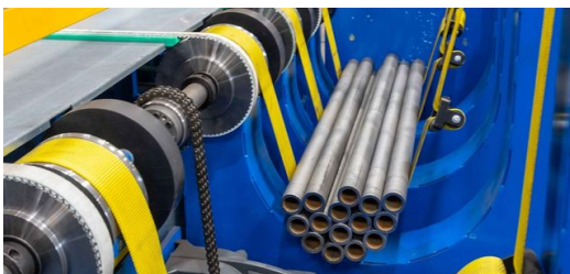
Nach dem Zuschnitt der Rohre auf der TruLaser Tube 7000 werden die Rohre zum Anlagenverbund transportiert, wo der Roboter sie in eine Bündelmulde einlegt und anschließend auf einem Tisch vereinzelt.

Bei der Produktion des Querrohrs der Anhängerkupplung sorgt die Prozesskette Rohr nun für einen flüssigen Prozess: Die TruLaser Tube 7000 fiber erledigt den Zuschnitt der Rohre und bringt Konturen ein. Anschließend werden die Rohre zur transfluid® Rohrbiegemaschine transportiert und automatisiert mit dem Roboter beladen. Nach dem Biegen bringt der Roboter die Bauteile zur TruLaser Cell 8030. Dort erfolgt die Endbearbeitung. Die 3D-Laseranlage schneidet Konturen aus, die vor dem Biegen nicht eingebracht werden können, weil sie sich sonst verziehen würden.