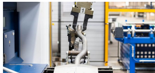
Die Anlagen im Maschinenverbund werden automatisiert von einem Robotersystem bedient, das die Teile automatisiert von einem Bearbeitungsschritt zum nächsten transportiert.