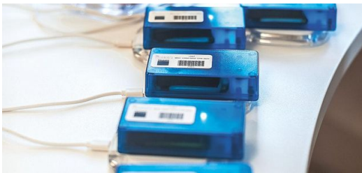
Prototyp: So sahen die Marker während der Testphase aus.