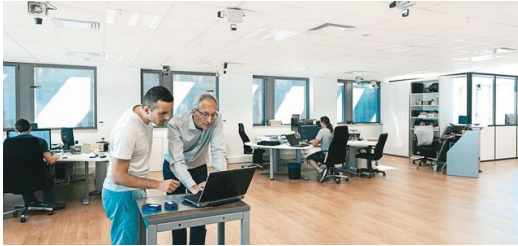
Das französische Start-up BeSpoon mit Sitz in Le Bourget du Lac verfolgt das Ziel, Produktionsprozesse mit innovativen Software-Lösungen zu vereinfachen.

Der Anteil der Aufträge mit kleinen Stückzahlen wächst. Vielen Betrieben fällt es zunehmend schwerer, den Überblick zu behalten, welchen Prozessschritt die Aufträge gerade durchlaufen und wo die Teile dazwischen lagern. Für effiziente Abläufe ist Transparenz aber eine wichtige Voraussetzung, gerade wenn es darum geht, Eilaufträge durch die Fertigung zu jagen. „Metall und Radiowellen vertragen sich eigentlich überhaupt nicht. Das hat die Lokalisierung im Blechbearbeitungsbereich vorher fast unmöglich gemacht. Wir können mit unserem Produkt Abhilfe schaffen. Mit der präzisen und gleichzeitig robusten Ultra-Wideband Technologie, dem sogenannten UWB, gelingt es uns, Objekte auch dann nachzuverfolgen, wenn sie sich in einer Umgebung mit viel Metall befinden.“