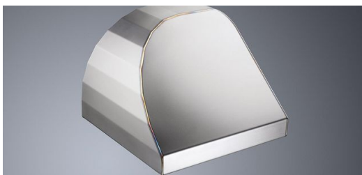
Eine Haube aus Baustahl, 1,5 mm, die optisch hohen Anforderungen genügen muss, mit einer Schweißnaht von 122 cm Länge: Bei einer Losgröße von 10 x 50 Stück pro Jahr sind hier Einsparungen von 65 Prozent möglich. Die Kalkulation basiert auf für Deutschland typischen Durchschnittswerten.

Wer dagegen in die Laserschweißtechnologie investiert und sich hier Kompetenzen aufbaut, steigt in eine andere Qualitätsklasse der Blechbearbeitung auf. Das beginnt bei der hervorragenden Nahtqualität: Das Verfahren Wärmeleitschweißen erstellt Nähte mit exzellenter Oberflächengüte. Damit gelingen Sichtnähte, die nur wenig oder gar keine Nacharbeit mehr benötigen. Und da beim Laserschweißen weniger Wärme in das Bauteil eingebracht wird, gibt es auch kaum Verzug. In vielen Fällen kann das nachträgliche Richten komplett entfallen.