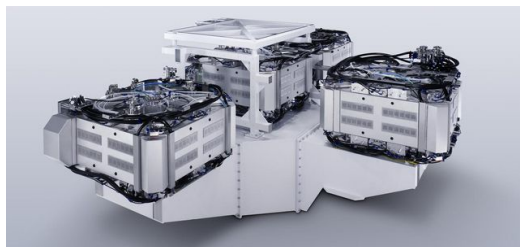
Der TRUMPF Laser Amplifier liefert den Laserpuls für das EUV-Projekt.