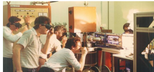
1985 baut TRUMPF seinen ersten eigenen CO 2 -Laser, den TLF 1000. Er hat eine Laserleistung von 1 Kilowatt.

Mit dem von Paul Seiler und seinem Team 1971 entwickelten Laser-Komponenten-System war es erstmals möglich, Glühkerzen ohne Vorglühen für Dieselmotoren in Großserie herzustellen.