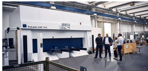
Die TruLaser Cell 7040 in der Produktionshalle von Omas S.p.a.