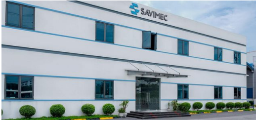
SAVIMEC produziert in einer 12.000 Quadratmeter großen Produktionshalle inmitten des wichtigen Wirtschaftsdreiecks Hanoi, Quang Ninh und Hai Phong.