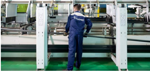
In Vietnam ist die Nachfrage nach Laser-Rohrschneidern in den vergangenen Jahren gestiegen. Mit der TruLaser Tube 5000 fiber bedient SAVIMEC den wachsenden Markt.