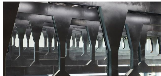
Der Skywalk ist Teil der frei tragenden Deckenstruktur aus Stahl, die von einem TRUMPF Kunden in Atlanta gefertigt wurde.