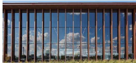
Im Fokus der Smart Factory stehen Beratung und Training der Kunden bei der Einführung von digital vernetzten Fertigungslösungen.