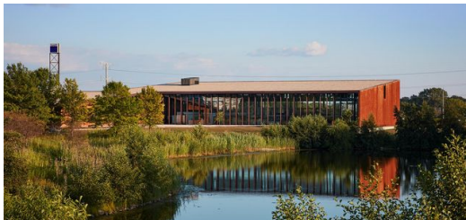
Der Standort Chicago ist für die Smart Factory wie geschaffen. Rund 40 Prozent der blechbearbeitenden Industrie in den USA befinden sich in den direkt umliegenden Staaten.

Wenn „Show“ und „Fabrik“ zusammenkommen, entsteht garantiert etwas Anschauliches. TRUMPF hat es damit einmal mehr besonders weit getrieben. Die im September 2017 eröffnete Showfabrik in Chicago schafft es nicht nur, die digitale Vernetzung greifbar zu machen, sondern sieht auch noch futuristisch aus und vermittelt einzigartige Perspektiven: Mit zahlreichen teils transparenten Bildschirmen und direktem Blick auf den Shopfloor bietet ein Kontrollraum die volle Übersicht über alle Maschinen. Ein Gang in luftiger Höhe, der die gesamte Produktionshalle überspannt, macht die verketteten Produktionsanlagen von oben transparent. Die Smart Factory in Chicago zeigt, was heute in der Blechfertigung mit modernsten Mitteln möglich ist. Es geht nicht wie in anderen Vorführzentren um einzelne Produkte, sondern um das ganzheitliche Zusammenspiel in der Fertigung. Deshalb bildet Chicago die komplette Wertschöpfungskette der Kunden ab und ermöglicht es ihnen sogar, eigene Aufträge einzulasten.