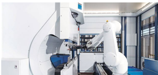
Innovative Highspeed-Biegezelle: Die TruBend Cell 7000 ist ein kompaktes System, mit dem sich Kleinteile hochdynamisch und wirtschaftlich biegen