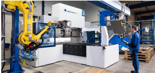
Die neue Schwenkbiegemaschine TruBend Center 7020 hat die Produktion des Feldofens erst möglich gemacht. Nur mit dieser Anlage konnte das Team bei Kuipers den relativ großen Brennraum von 333 Millimetern automatisiert biegen.