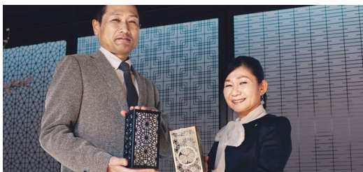
Bestseller: Windlichter mit komplexen geometrischen Mustern – jedes davon ein Unikat.