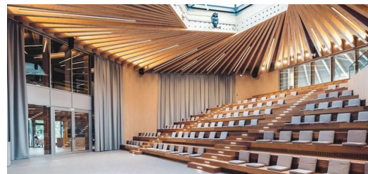
Lichtdurchflutet: Statt Stühlen gibt es in der Aula des neuen Ausbildungszentrums lange Sitzreihen. Zuhörer sollen miteinander ins Gespräch kommen.