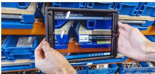
<p>An jedem Arbeitsplatz registrieren die Mitarbeitenden jeden Arbeitsschritt vom Anfang bis zum Ende auf Tablets in einer App. Der mobile Zugriff auf alle Informationen erleichtert den Arbeitsalltag und bringt Transparenz in die Abläufe.</p>