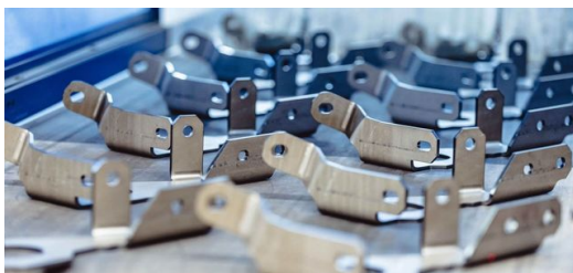
<p>In der eigenen Blechfertigung verarbeitet MERZ im Dreischichtbetrieb täglich zwischen zehn und 15 Tonnen Dünnblech. Eine hohe Teilevarianz bei Stückzahlen von eins bis 1.000 sowie ein hoher Termindruck sind Herausforderungen, die zum Arbeitsalltag gehören.</p>