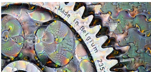
Der Traum im Werkstück?

Hinzu kommt, dass Laser, ausgestattet mit einem Rucksack voller Sensoren, Unmengen an Daten produzieren, die immer wertvoller werden. Mit menschlichem Erfahrungswissen trainierte Algorithmen werden in diesem Wust immer wieder neue Muster erkennen, die ein Mensch unmöglich sehen kann, und ihre Schlüsse daraus ziehen. Solche KI-Systeme werden genau in dieser Sekunde überall auf der Welt entwickelt. Sie werden nach und nach sowohl die Lasermaterialbearbeitung verbessern als auch die Laser selbst. Wie bei den Schachspielern von heute werden Laseranwender in zehn Jahren die besten Laseranwender aller Zeiten sein – und ihre KI lieben gelernt haben.