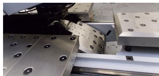
Vorher und Nachher: Altmaschine von TRUMPF nach der Überarbeitung.