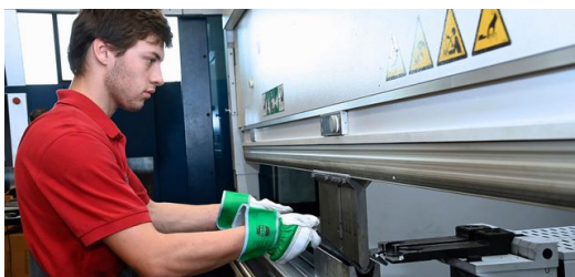
Assistenzsysteme und Software helfen bei der Arbeit: Die TruBend 5230 im

Bis Fischer auf TecZone Bend kam. Das TRUMPF Programm simuliert Biegungen in 3D und prüft automatisch die Machbarkeit. „Faszinierend!“, fand Fischer, „wir haben gleich gesagt, ok, das brauchen wir!“ Schnell wurde jedoch auch klar: „Um das Programm voll auszunutzen, brauchen wir dazu eine TRUMPF Abkantbank.“ Dann investierte Fischer in die TruBend 5230 – und hat es nicht bereut. Ausschlaggebend waren dabei nicht zuletzt die drei Optionen Part Indicator, ACB Laser und ACB Wireless.