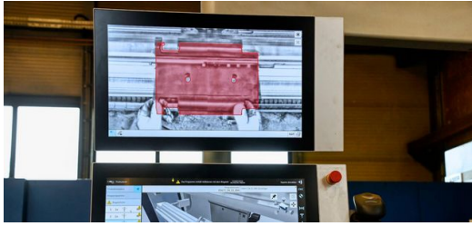
Der Part Indicator im Einsatz: Das System zeigt sofort an, ob das Biegeteil richtig oder falsch eingelegt ist. Rot heißt, hier ist noch ein Fehler.