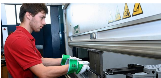
Assistenzsysteme und Software helfen bei der Arbeit: Die TruBend 5230 im

Bis Fischer auf TecZone Bend kam. Das TRUMPF Programm simuliert Biegungen in 3D und prüft automatisch die Machbarkeit. „Faszinierend!“, fand Fischer, „wir haben gleich gesagt, ok, das brauchen wir!“ Schnell wurde jedoch auch klar: „Um das Programm voll auszunutzen, brauchen wir dazu eine TRUMPF Abkantbank.“ Dann investierte Fischer in die TruBend 5230 – und hat es nicht bereut. Ausschlaggebend waren dabei nicht zuletzt die drei Optionen Part Indicator, ACB Laser und ACB Wireless.