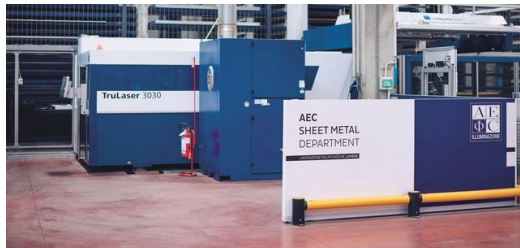
Mit der 2D-Laserschneidmaschine TruLaser 3030 fiber legte AEC Illuminazione den Grundstein für die enge Zusammenarbeit mit TRUMPF. Die Anbindung an ein automatisiertes Lager hat die Fertigung enorm beschleunigt.

in den Gängen auf die Weiterbearbeitung. Damit es nicht dazu kommt, braucht es transparente und durchgängige Informationsflüsse. Aus diesem Grund hat Bianchi bereits jetzt 85 Prozent aller Maschinen vernetzt. Das Produktionssteuerungssystem MES erstellt Produktionspläne und sorgt dafür, dass die Fertigung im Fluss ist. Die Konstrukteure übermitteln ihre CAD-Zeichnungen direkt an die Maschine. Dort werden die Daten eingelesen und dann gefertigt, wenn die Teile benötigt werden. Außerdem sammelt MES Maschinendaten und Kennzahlen zur Qualitätsüberwachung, zur Maschinenauslastung sowie zum Produktionsstatus. „Mit dieser umfassenden Vernetzung ist es uns gelungen, unsere Produktion transparent zu machen. Diese auf den Menschen und die Maschine ausgerichtete Produktionsplanung hilft uns, die Durchlaufzeiten zu erhöhen und unsere Liefertreue nachhaltig zu verbessern“, resümiert Bianchi.