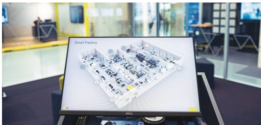
Maschinendaten, wie sie TRUMPF in seiner Smart Factory erhebt, helfen dem Computer-Vision-Team, die KI zu trainieren.