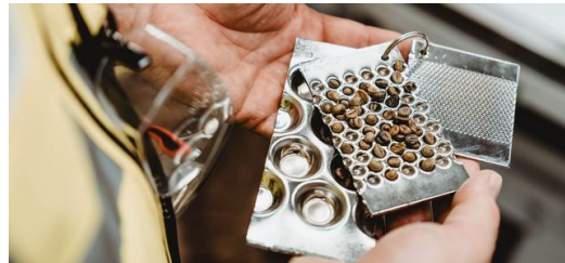
Passgenau: Das Korn muss exakt in die Vertiefungen im Blech, die „Taschen“, passen.