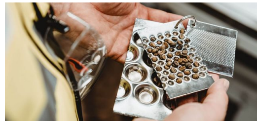
Passgenau: Das Korn muss exakt in die Vertiefungen im Blech, die „Taschen“, passen.