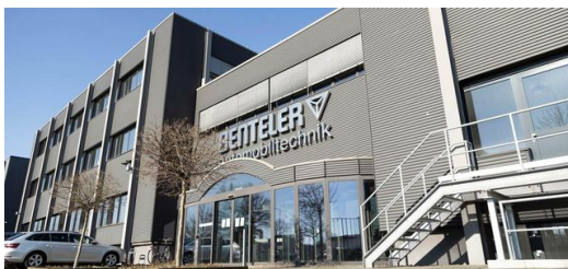
<p>BENTELER ist ein Familienunternehmen in vierter Generation. Der