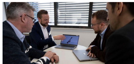
<p>Die von TRUMPF speziell für BENTELER entwickelte MultiFokus-Optik bringt in Verbindung mit BrightLine Weld hervorragende Ergebnisse beim porenfreien gasdichten Schweißen von Aluminium.</p>