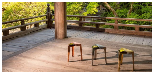
Der Stuhl „Orisu“ ist etwas Besonderes: Er macht abstrakte Technologien für den Betrachter sichtbar.