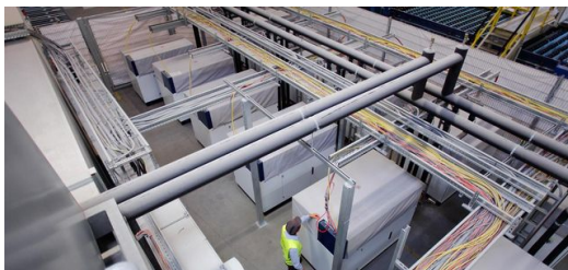
Zwölf Hochleistungslaser erzeugen 144 Kilowatt Leistung.