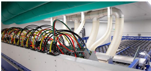
Laserlichtleitungen verbinden die Optiken mit den Lasern.