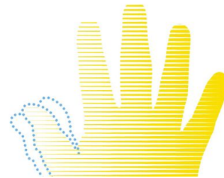
Karl Deisseroth wagt den Selbstversuch mit einer transkraniellen Magnetstimulation. Sein Daumen zuckt. - Gernot Walter