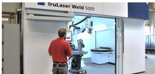
Geld gespart: Bei dem Blechbearbeiter Schink arbeiten die Laserschweißzelle TruLaser Weld 5000 und die Laserschneidanlage TruLaser 3040 im sogenannten LaserNetwork. Sie nutzen also gemeinsam die vier Kilowatt starke Festkörperlaserquelle TruDisk 4001.

Am Beispiel des bereits erwähnten Mehlstreuers machen die oberfränkischen Blechexperten deutlich, in welcher Kategorie die Produktivitätssteigerungen liegen. Ein Handschweißprozess benötigt inklusive aufwendiger Vorbereitung und diverser Nachbearbeitungen etwa 110 Minuten. Mit der TruLaser Weld 5000 erledigt Schink das prozesssicher in gut 10 Minuten – Vorbereitung inbegriffen. Nacharbeit ist nicht notwendig!