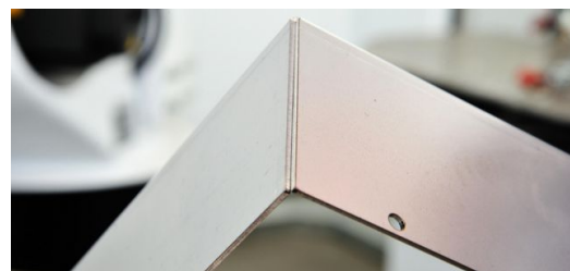
Bei Bauteilen mit Spalten oder ungünstigem Überlapp muss „tolerant“ lasergeschweißt werden. Die TruLaser Weld 5000 bietet diese Möglichkeit mit der Option „FusionLine“.