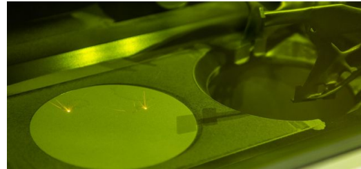
<p>Die TruPrint 1000 von TRUMPF erfüllt mit ihrem pulsierenden Laser auch hohe Ansprüche an die Oberflächenqualität. Dank Multilaser-Technologie fertigt sie außerdem sehr produktiv.</p>