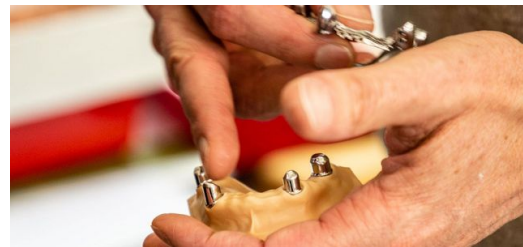
<p>Die Primärteile (unten) werden auf vorhandene und präparierte Zahnstümpfe zementiert. Das Sekundärteil (oben) ist verbunden mit Schienen für die Ersatzzähne und wird auf die Primärteile aufgesetzt.</p>