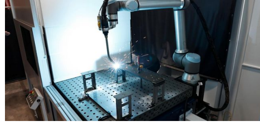
Die automatisierte Schweißzelle, die einfach zu programmieren ist, viele Parameter bereits integriert hat bei gleichzeitig hohem Qualitätsanspruch: die TruArcWeld 1000 von TRUMPF