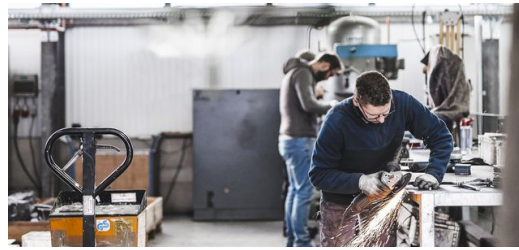
<p>2015 zog IBEX in eine 2.300 Quadratmeter große Produktionshalle mit angeschlossenem Büro in Dresden.</p> – Marlen Mieth