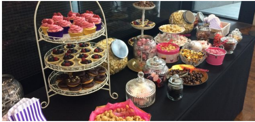
<p>Bei Cupcakes und Brownies lernen sich die Teilnehmer der 1. AgileDays bei TRUMPF besser kennen.</p>

Mein persönliches Programm habe ich mithilfe der Konferenz-App selbst erstellt. Weil ich Agile-Neuling bin, habe ich mich online für den Workshop „Scrum Lego City“ eingetragen. Hier sollen die Teilnehmer die Scrum-Methode kennenlernen, indem sie als Team eine Stadt aus Lego-Steinen planen und bauen. Das Konzept stammt aus der Softwareentwicklung und wird heute in den verschiedensten Branchen eingesetzt. Für unsere Lego-Stadt erhalten wir konkrete Vorgaben, zum Beispiel ein Schwimmbad mit Rutsche oder Infrastruktur für öffentliche Verkehrsmittel. Im „Backlog“ und im „Planning“ beurteilen wir die Bauprojekte nach ihrer Komplexität und legen die Zeitschiene und die Verantwortlichkeiten fest. Im Sprint stürzen wir uns auf die bunten Legohaufen und bauen Schaukeln, Fahrradständer und Krankenhäuser. Bevor wir alles im nächsten Sprint wiederholen, werfen wir im „Review“ einen Blick auf die Ergebnisse und legen in der „Retro“ Optimierungsmaßnahmen fest. So kommen wir in weniger als einer Stunde zu einer perfekten Stadt.