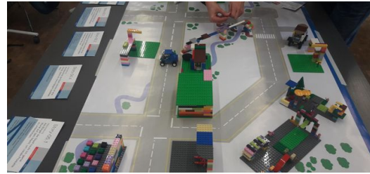
<p>Beim Workshop „Scrum Lego City“ bauen wir mit der Scrum Methode eine Stadt aus Lego Steinen.</p> – TRUMPF