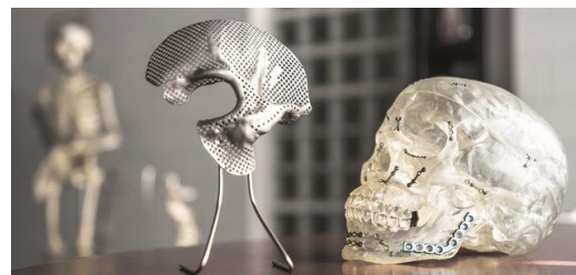
Was das Auge nicht sieht: Die im 3D-Druck herstellbaren Oberflächen sind entscheidend dafür, dass Implantate und Knochen zusammenfinden.