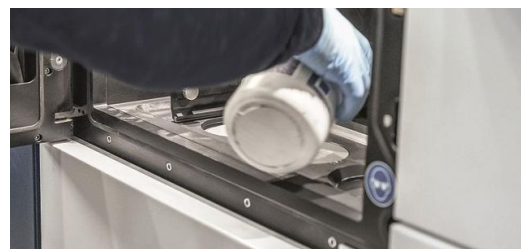
Pulver für die Gesundheit: Für CONMET bietet 3D-Druck doppeltes Potenzial. Zum einen lassen sich individuelle Implantate drucken, zum anderen innovative Serienimplantate.