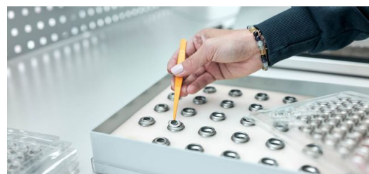
Vorbereitung für den Schweißprozess: Das Platzieren der Linsen auf den Edelstahlhülsen ist nach wie vor Handarbeit.