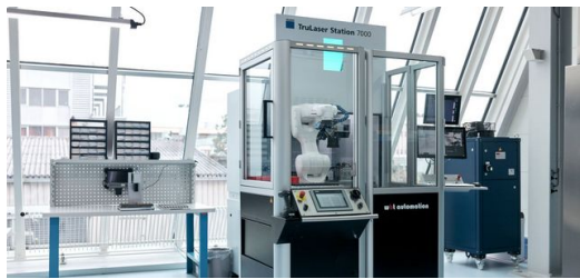
Effizientes Duo: Am schweizerischen Standort Widnau schweißt der Endoskop-Hersteller Karl Storz Okulare auf einer TruLaser Station 7000. Eine mobile Roboterzelle übernimmt das Be- und Entladen der Bauteile.