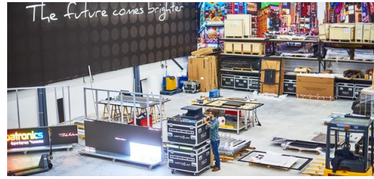
<p>Individuell: Apametal entwickelt und baut jedes digitale Schild selbst.</p> <p>– Frederik Dulay-Winkler</p>