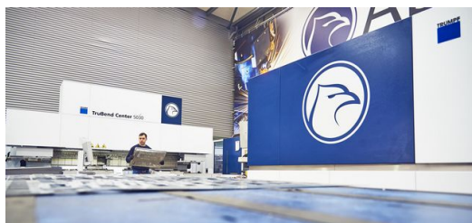
<p>Modernerste Technologie: Arbeiter mit der TruBend Center 5030</p>