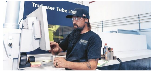
Benchmark: Mit enorm schnellen Durchlaufzeiten hebt sich PTL von vielen Job Shops in den USA ab.