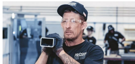
Einstellungssache: Für einen Job bei PTL zählen vor allem Einsatzbereitschaft und der Wille, jeden Tag dazuzulernen.