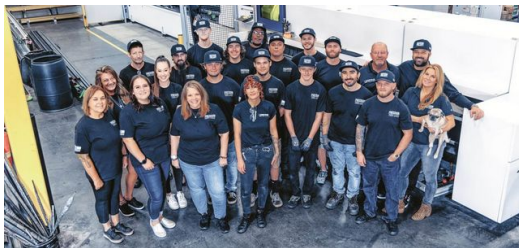
Teamwork: Die Precision-Belegschaft fühlt sich als große Familie, in der jeder auf den anderen achtet.

Software von TRUMPF hilft, die Maschinen schnell für unterschiedliche Bauteile einzurichten und die Produktion zuverlässig zu steuern. „Wir lieben Technologie und investieren kontinuierlich in die Digitalisierung unseres Unternehmens“, so Jordan. Im März 2023 kam eine TruLaser Center 7030 dazu – ein „Game-Changer“, wie es bei PTL heißt. „Die Integration der neuen Maschine in unsere Arbeitsabläufe nimmt Zeit in Anspruch“, weiß der Gründer. Aber am Ende verschafft sich der Job Shop damit einen Vorteil gegenüber Mitbewerbern. „Wir können mit einem 25-köpfigen Team künftig automatisiert rund um die Uhr produzieren.“ Precision Tube Laser fokussierte sich von Anfang an auf digitales Marketing, nutzt Instagram und YouTube, um eine starke Community aufzubauen und sich mit ihr auszutauschen. Die Videos und Posts vermitteln Expertenwissen pur. Immer wieder geht es um die optimale Teilegestaltung. Das Design soll toll aussehen, klar. Aber PTL muss in der Lage sein, die Geometrie eins zu eins auf seine Maschinen zu übernehmen. „Im Dialog gehen wir die Konstruktionspläne so lange durch, bis wir das Metall bearbeiten können“, erklärt Jordan. Das stärkte das Vertrauen der Kunden, mit Precision Tube Laser den bestmöglichen Partner an der Seite zu haben.