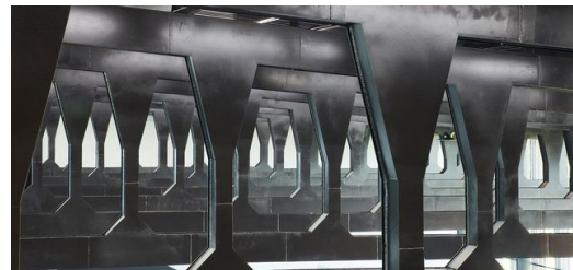
Der Skywalk ist Teil der frei tragenden Deckenstruktur aus Stahl, die von einem TRUMPF Kunden in Atlanta gefertigt wurde.