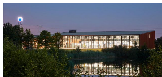
Die Investitionssumme für den 5.500 Quadratmeter großen Standort lag bei 13 Millionen Euro. verantwortlich für den Entwurf des Gebäudes zeichneten Barkow Leibinger Architekten aus Berlin.