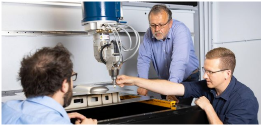
Miteinander diskutieren, streiten und gemeinsam Lösungen suchen: die gute Zusammenarbeit zwischen Söhnen und Vater hat das Unternehmen weit vorangebracht, mit Kurs auf die Smart Factory.