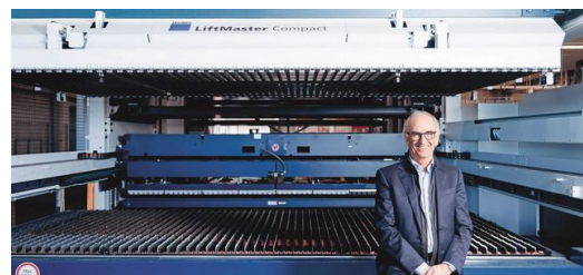
In Kombination mit dem LiftMaster Compact und dem Part Master schneidet das System die Teile in der Fertigung des Kühlmöbelherstellers