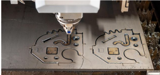
<p>Das Bauteil wurde noch auf der Standardmaschine fürs Laserschweißen angefast. Damit spart TRUMPF aufwendige Folgeprozesse ein.</p>