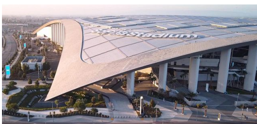
Leicht und elegant wirkt das Dach des SoFi Stadiums. Die Abdeckung aus dem lichtdurchlässigen Kunststoff ETFE lässt sich öffnen und schließen.

Mit rund 5 Milliarden Euro Baukosten gilt das SoFi Stadium samt umliegendem Sport- und Unterhaltungskomplex mit Veranstaltungshallen, Parks und Gastronomie nahe Los Angeles als das teuerste Stadion der Welt. Zur besonderen Herausforderung wurde der Bau auch für TRUMPF und seinen US-Kunden A. Zahner. Für das SoFi schnitten und stanzen die Amerikaner aus Missouri auf drei TRUMPF Maschinen 37 000 unterschiedliche Paneele mit rund 30 Millionen unregelmäßig verteilten Löchern. Möglich machte es eine individuelle Software-Lösung aus Ditzingen.