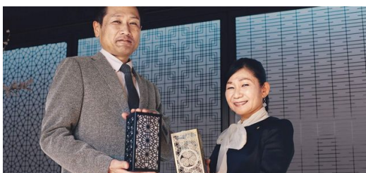
Bestseller: Windlichter mit komplexen geometrischen Mustern – jedes davon ein Unikat.